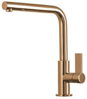
Monomando Omega Copper 8497 400